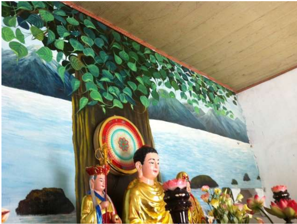
Chánh điện Chùa Bảo Sơn, trần nhà bị nứt, dột