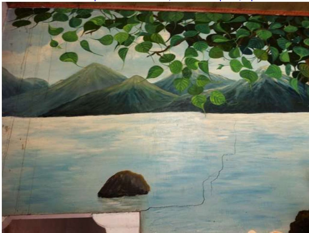
Tường vách cũng nứt nẻ