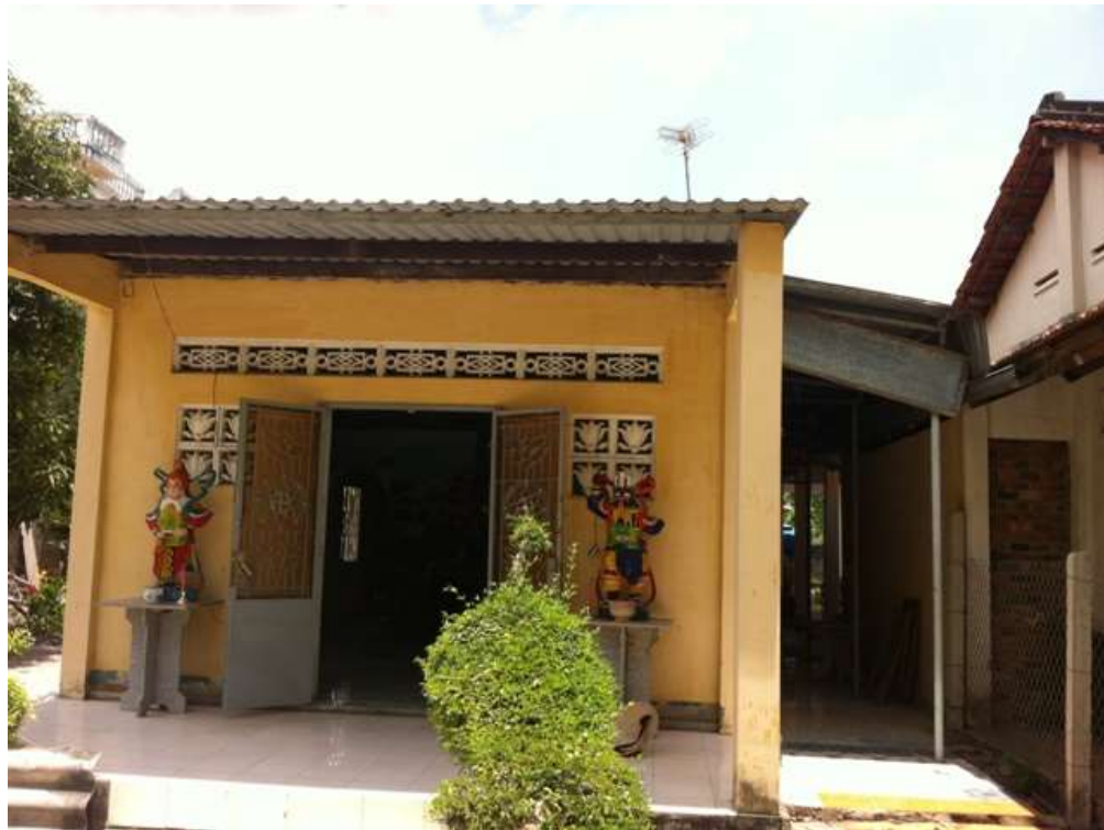
Chánh điện lợp mái tôn, chiều ngang 4 mét