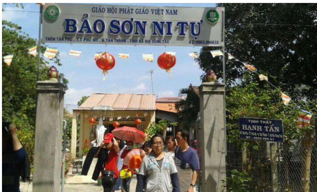
Phật tử hành hương dịp Tết Bình Thân Bảng tên Chùa Bảo Sơn đã được dựng lên