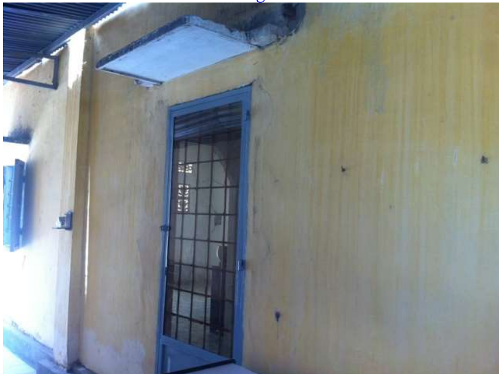
Bên hông chánh điện, cửa mở vào nhà hậu Tổ