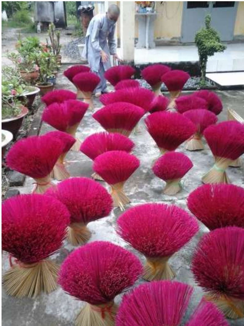
Nhuộm chân nhang, phơi