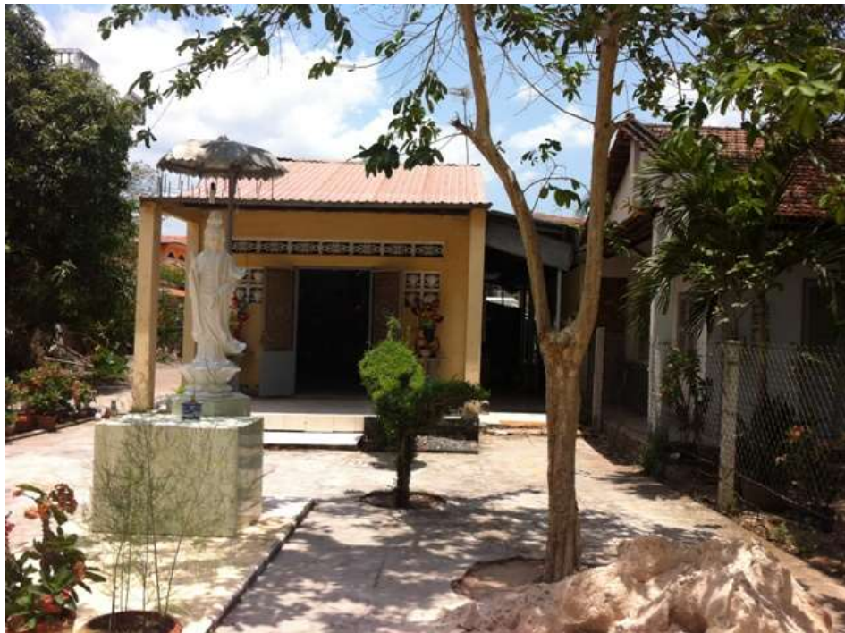
Tôn tượng Quán Âm lộ thiên trước ngôi chánh điện nhỏ hẹp của Chùa Bảo Sơn