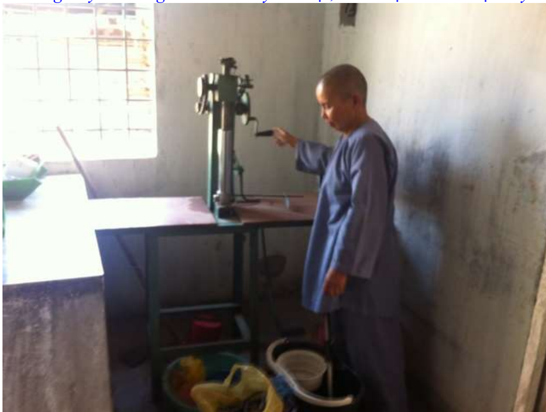
Ni sư đang giải thích cách trộn bột, se nhang