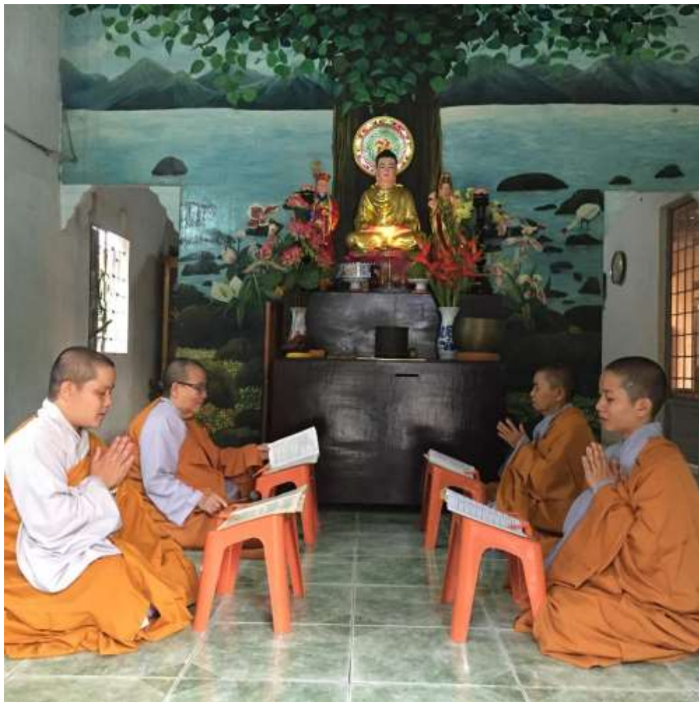
Một thời kinh ở Chùa Bảo Sơn