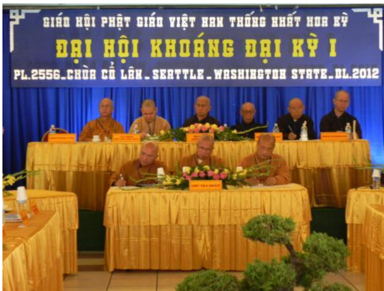
Đại Hội Khoáng Đại Giáo Hội PGVN Thống Nhất Hoa Kỳ