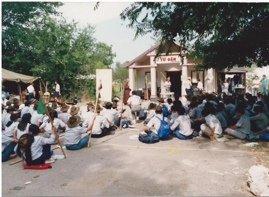
Một khóa học của Trại Huấn Luyện Lộc Uyển - A Dục 1988