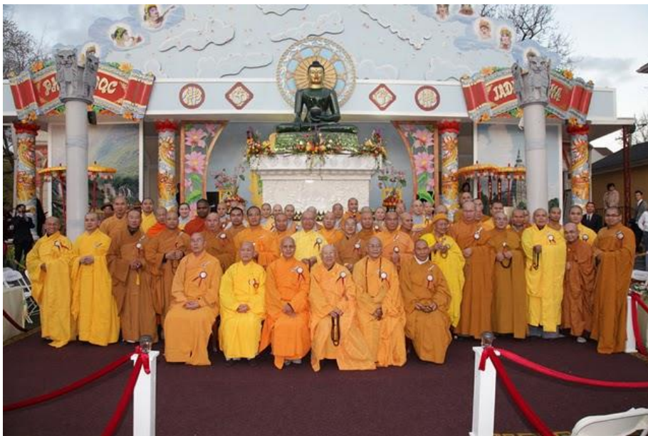
Phật Ngọc tại Trúc Lâm mà con là người phụ trách lộ trình Phật Ngọc

Ngoài những sinh hoạt của Miền Khánh Hòa sau này, Thầy và con còn gặp nhau rất nhiều qua những sinh hoạt của GDPT hay trên điện thoại với những hoài bão cho Tổ Chức GDPTVN Tại Hoa Kỳ, Nhưng thật sự Thầy và con chỉ có Một đề tài mà thôi! đó là GDPT mà nói hoài không hết.... Thầy đặt nặng việc kết hợp, thầy quan tâm đến Trại Trường GDPTVN tại Wills Point, Texas, thầy xem tất cả giấy tờ, bản vẽ và Thầy đã đề bạt rất nhiều ý kiến. Rồi Thầy lại khoe miếng đất của Thầy vừa mới mua để làm Tu Viện hay Trại Trường (Khi khóa tu là Tu Viện, khi cắm trại là Trại trường). rồi Thầy mơ ước và đã thành dự thảo cho sự kết hợp qua hình thức Tu Học Chung, Trại Chung và đặc biệt là “LỄ HỘI GDPTVN Tại Hoa Kỳ” tổ chức 1 tuần lễ tại Miền Nam California. Tấm lòng của thầy rộng lớn quá! Có thể nói là Thầy đã dành trọn đời cho Gia Đình Phật Tử Việt Nam