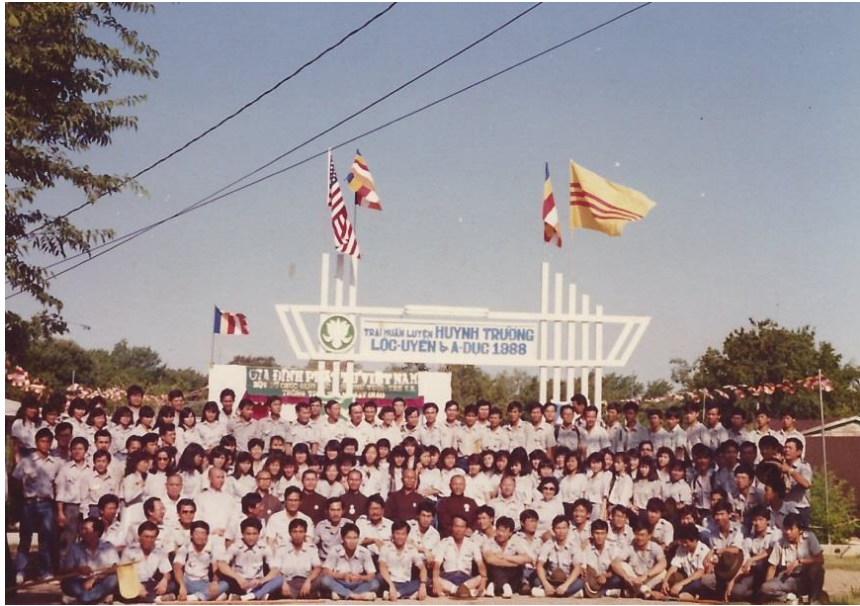
Liên Trại Huấn Luyện Lộc Uyển - A Dục tại Tổ Đình Từ Đàm, Dallas 1988