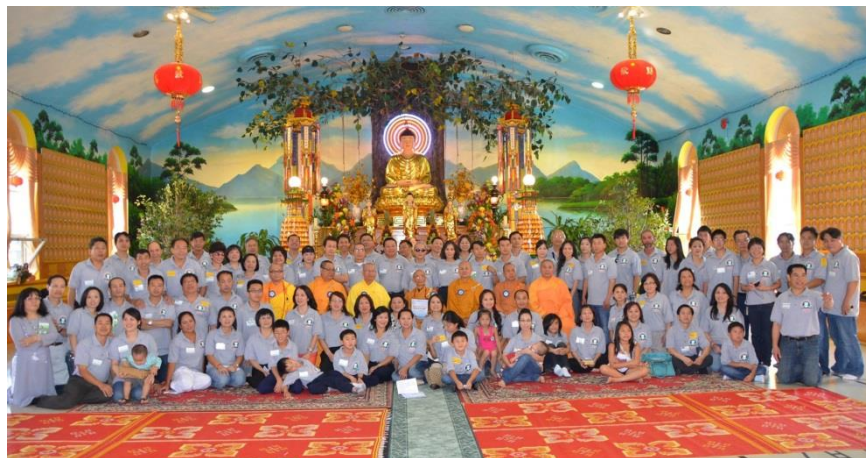
Hội Ngộ GDPT Long Hoa – Galang tại Canada