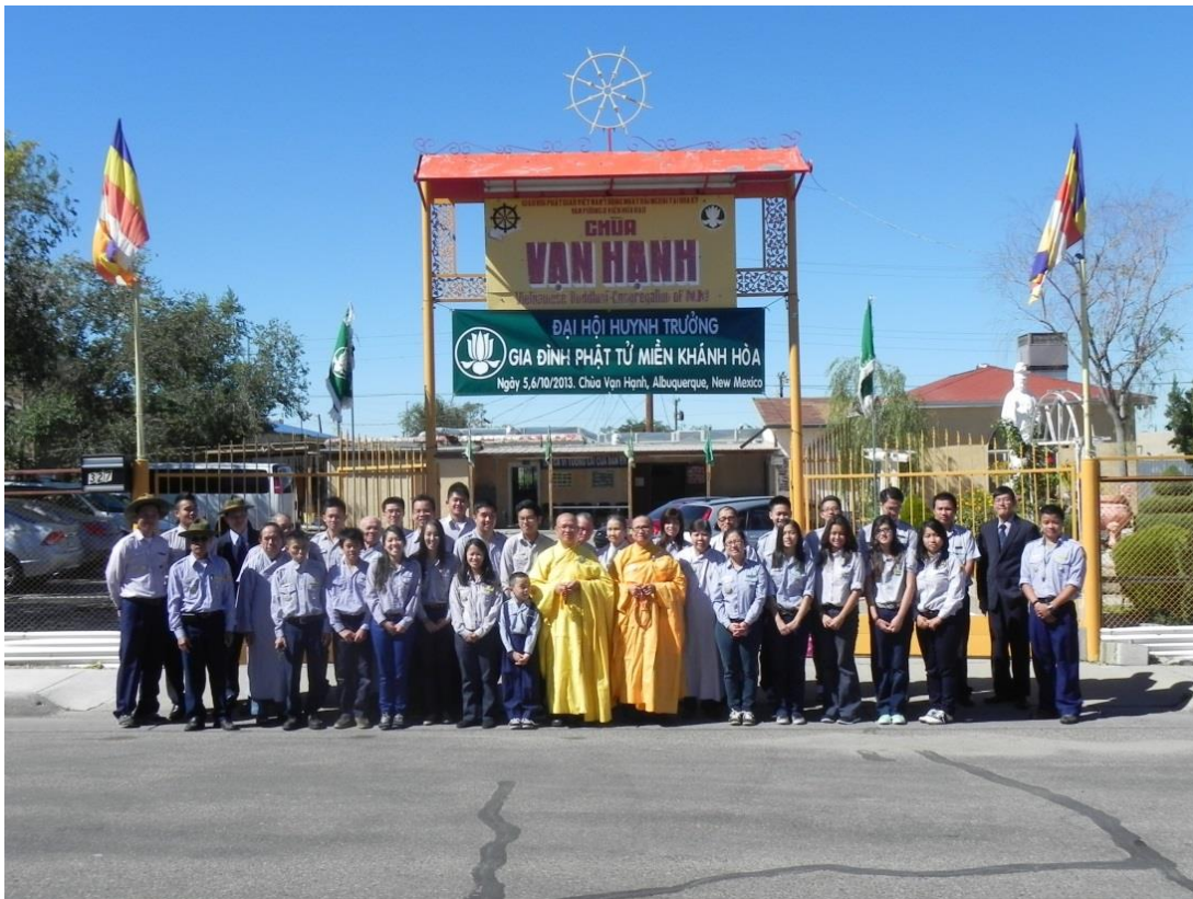
Đại Hội Huynh Trưởng GDPT Miền Khánh Hòa Tại Chùa Vạn Hạnh, Albuquerque, New Mexico - 2013