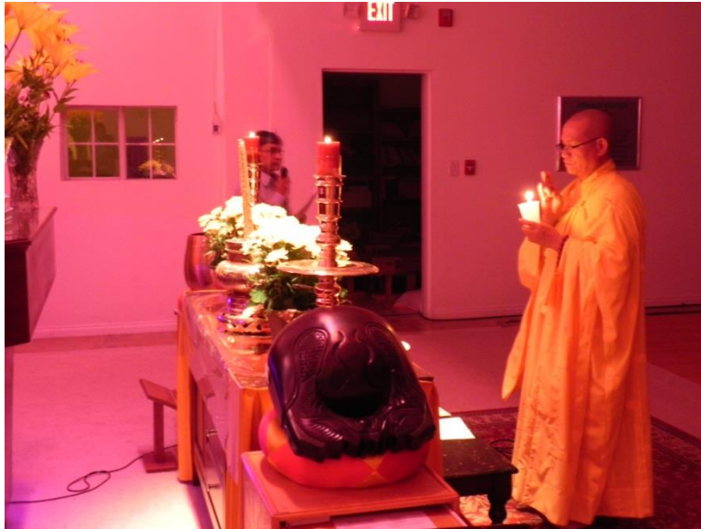
Chú nguyện ngọn nến truyền đăng