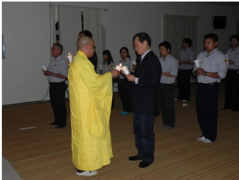
Chứng minh Lễ Phát Nguyện Tân Ban Hương Dẫn