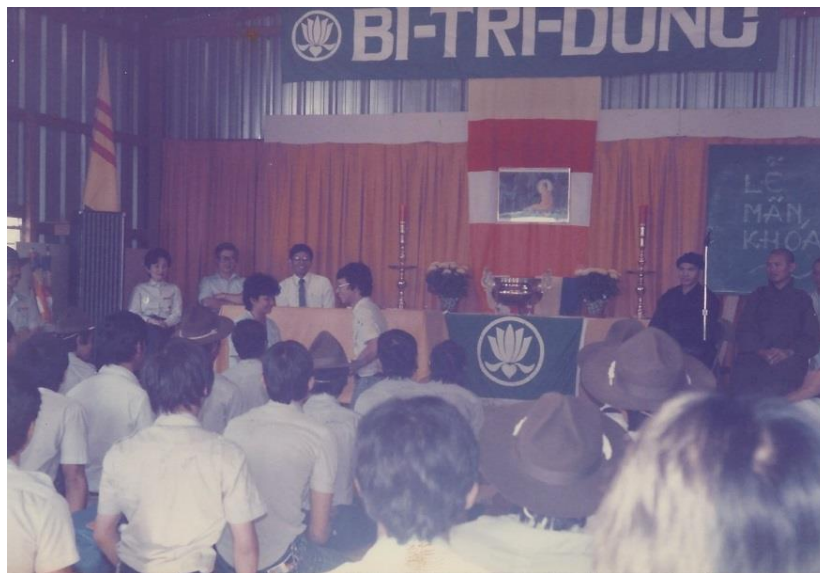
Trại Huấn Luyện Lộc Uyển tại Oklahoma Tháng 7/1985