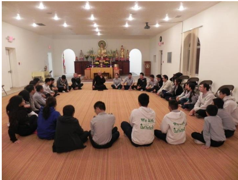
Đêm tâm tình cùng Thầy