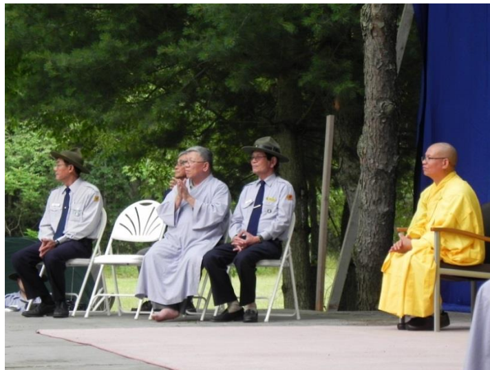
Liên Trại Huấn Luyện Lộc Uyển – A Dục Miền Thiện Hoa