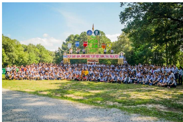
Trại Họp Bạn Hoa Lam