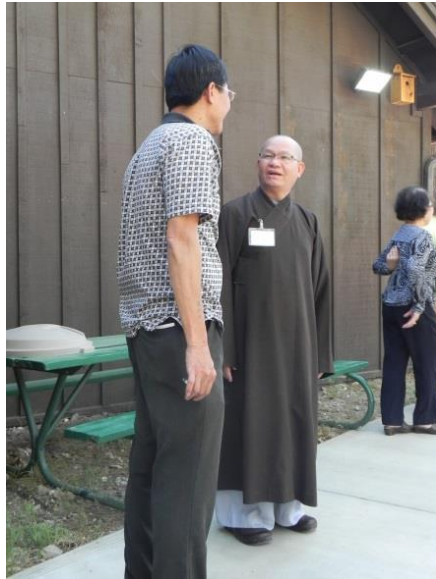
Trại Tĩnh Thức, Nam California, nơi phát sinh ý tưởng LỄ HỘI GDPTVN Tại Hoa Kỳ