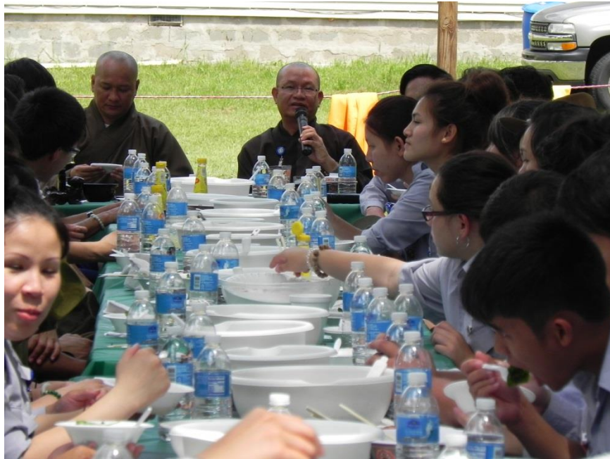
Liên Trại LU-AD Miền Thiện Hoa - 2013