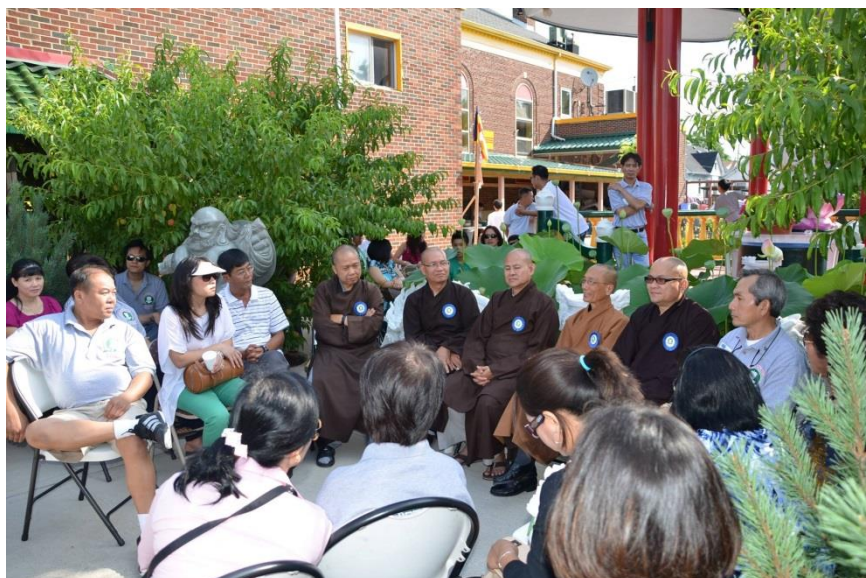
Hội Ngộ GDPT Long Hoa Kỳ II - 2012