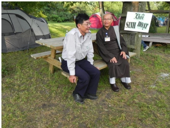
Thầy cho xem clip từ ngoài đường chạy vào miếng đất của thầy mới mua