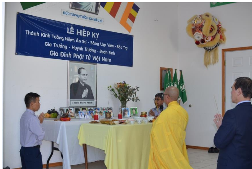
Thầy chủ lễ Hiệp Kỳ