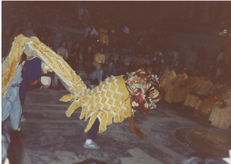
Đại Hội Tổng Hội Phật Giáo Việt Nam tại Đại Sảnh Olympia, Washington