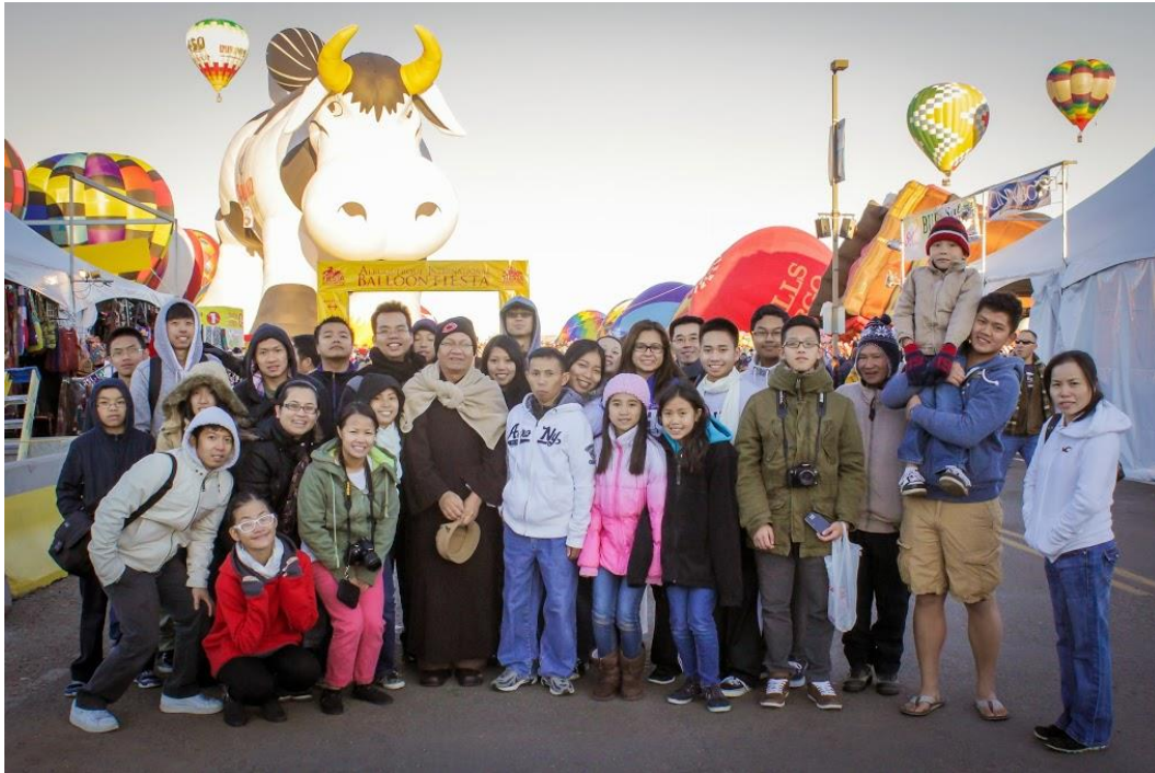
Những giây phút yên vui, tĩnh lặng, tuyệt vời

Ngoài những sinh hoạt của Miền Khánh Hòa sau này, Thầy và con còn gặp nhau rất nhiều qua những sinh hoạt của GDPT hay trên điện thoại với những hoài bão cho Tổ Chức GDPTVN Tại Hoa Kỳ, Nhưng thật sự Thầy và con chỉ có Một đề tài mà thôi! đó là GDPT mà nói hoài không hết.... Thầy đặt nặng việc kết hợp, thầy quan tâm đến Trại Trường GDPTVN tại Wills Point, Texas, thầy xem tất cả giấy tờ, bản vẽ và Thầy đã đề bạt rất nhiều ý kiến. Rồi Thầy lại khoe miếng đất của Thầy vừa mới mua để làm Tu Viện hay Trại Trường (Khi khóa tu là Tu Viện, khi cắm trại là Trại trường). rồi Thầy mơ ước và đã thành dự thảo cho sự kết hợp qua hình thức Tu Học Chung, Trại Chung và đặc biệt là “LỄ HỘI GDPTVN Tại Hoa Kỳ” tổ chức 1 tuần lễ tại Miền Nam California. Tấm lòng của thầy rộng lớn quá! Có thể nói là Thầy đã dành trọn đời cho Gia Đình Phật Tử Việt Nam