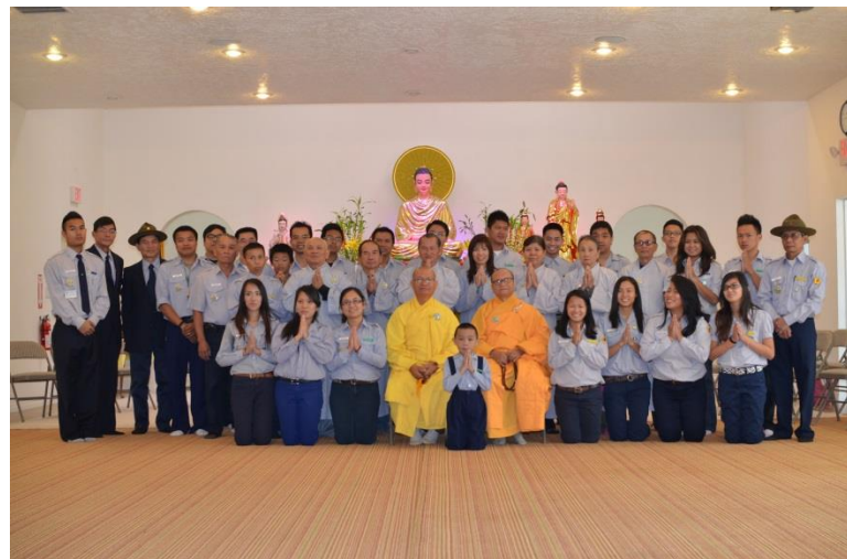
Chánh điện chùa Vạn Hạnh, New Mexico