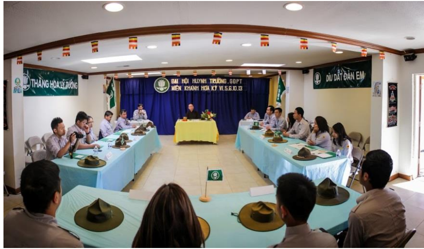
Quang cảnh Đại Hội Huynh Trưởng GDPT Miền Khánh Hòa Kỳ VI