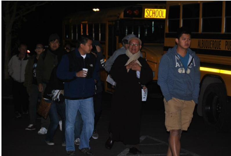
05 giờ sáng, trời lạnh đầy sương, Thầy cùng chúng con đi xem Lễ Hội Bóng Bay Quốc Tế tại Albuquerque, New Mexico