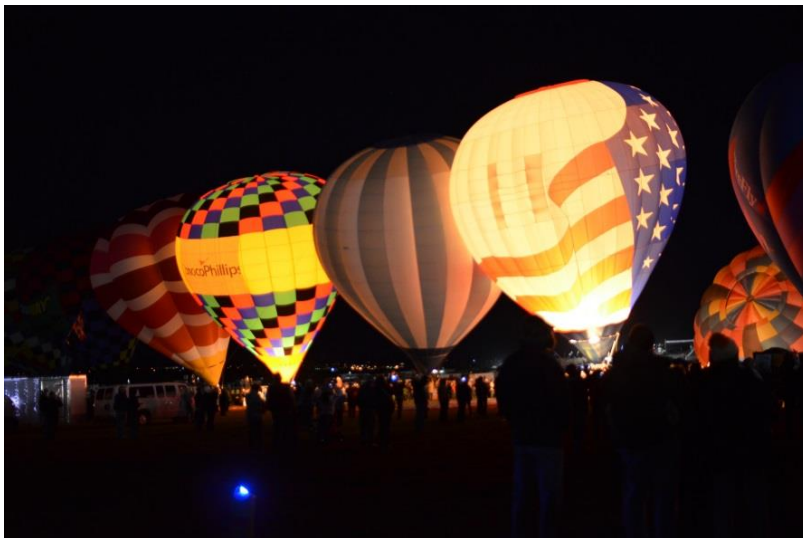
Albuquerque National Balloon Fiesta