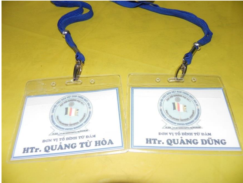
Đại biểu Tổ Đình Từ Đàm