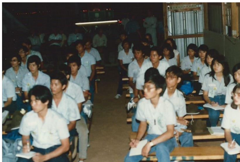
Trại Huấn Luyện Lộc Uyển 1985 mà giờ đây đã có vài người trở thành Tu Sĩ