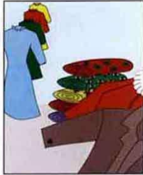
Kiếp trước: Hiến vải giúp Tăng Ni Đời nay: Không mặc gấm cũng mặc lụa