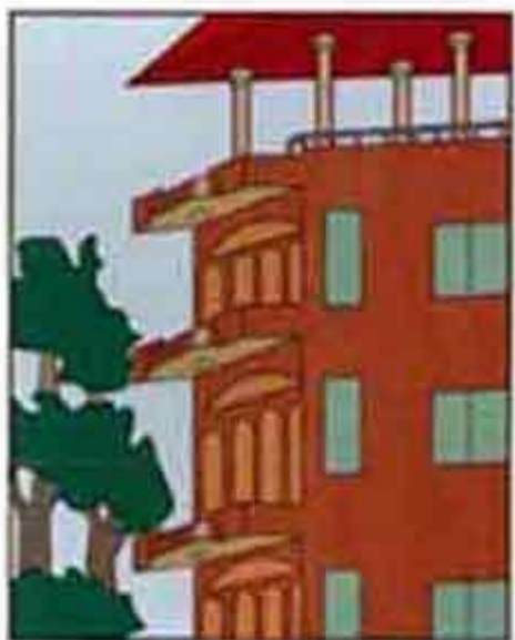
Kiếp trước: Cúng gạo cho chùa Đời nay: Ở nhà cao cửa rộng