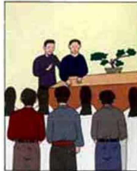
Kiếp trước: Phóng sinh bắt sát Đời nay: Con cháu đầy đàn