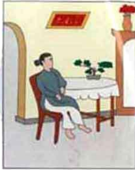
Kiếp trước: Cứu giúp người nghèo Đời nay: Được phú quý hiển vinh